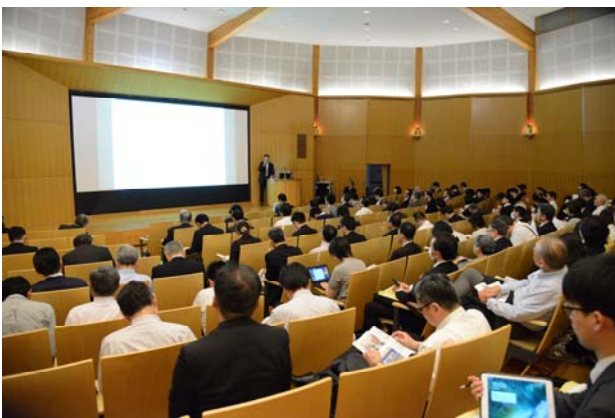
シンポジウム風景