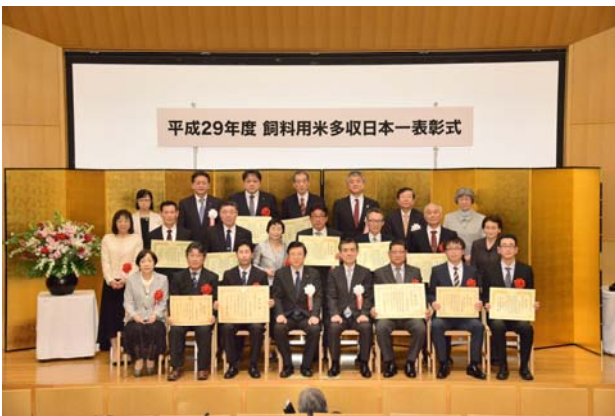
平成 29 年度 飼料用米多収日本一 表彰者記念撮影