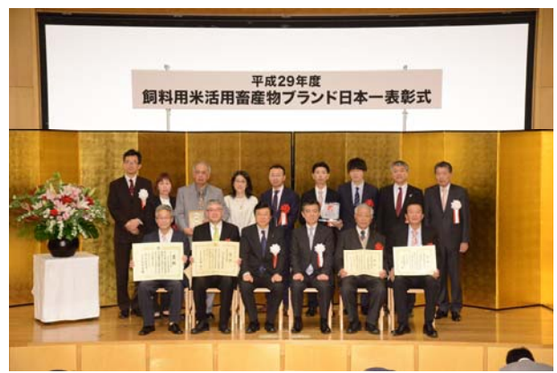
平成 29 年度 飼料用米活用畜産物ブランド日本一 表彰者記念撮影