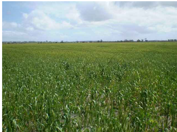
写真 西豪州(パース)の小麦農家 ー2007年9月24日

・西豪州の 1 区画が 100ha、全部で 5800ha を一戸で経営していても地域の平均より少し大きいだけという農業と日本の農業がまともに戦って勝って輸出産業になれるか。現場を見てほしい。日本で一番強い農業だといわれる北海道は、これと類似の輪作体系の畑作だが 40ha。日本で一番強い農業が先につぶれてしまう。